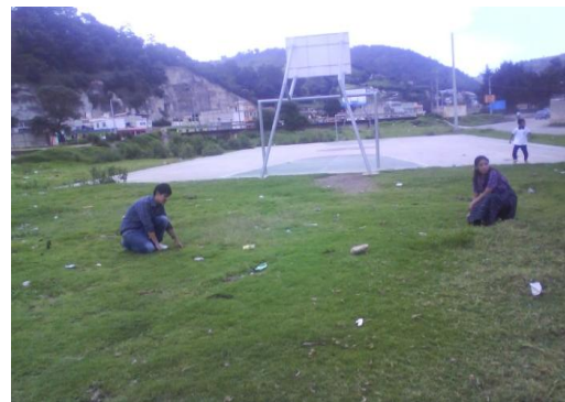
(4) MEDICIÓN DE UN TERRENO PARA LA IMPLEMENTACIÓN DE UN CENTRO DE CAPACITACIÓN, EN EL MUNICIPIO DE IXCHIGUÁN, SAN MARCOS