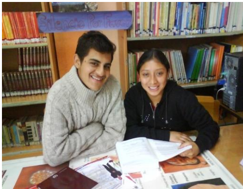
(3) TRABAJO DE INVESTIGACIÓN DE LOS ESTUDIANTES DE LOS EQUIPOS MULTIPROFESIONALES DEL MUNICIPIO DE TOTONICAPÁN