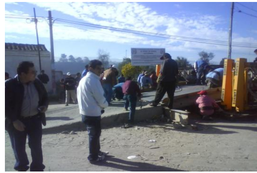
(2) APOYO PARA LA EJECUCIÓN DE ACTIVIDADES DEL CONCEJO MUNICIPAL