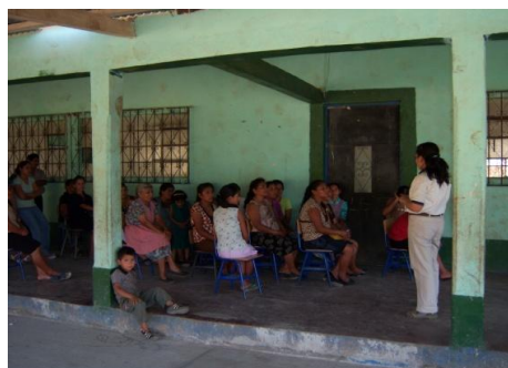
(1) Taller de violencia Intrafamiliar realizado en Aldea Galeras, Municipio de Huehuetenango Departamento de Huetenango (4 de marzo de 2010)