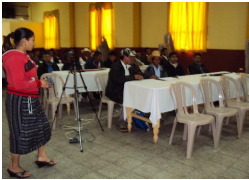
REUNIONES CON COCODES Y COMUDES DEL MUNICIPIO DE TOTONICAPÁN